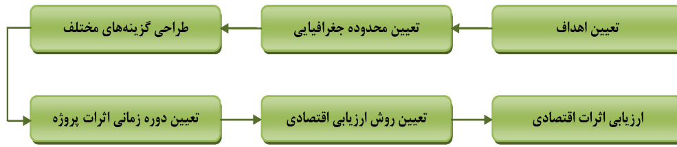
شکل ۱: فرایند انجام ارزیابی اثرات اقتصادی پروژه [۱].

۱- در هم‌پیمایی شخصی سازمان‌ها و کارفرمایان در تهیه وسیله‌نقلیه برای هم‌پیمایی نقشی ندارند و تنها با اعمال سیاست‌های تشویقی و ارایه خدمات سعی در افزایش مزایا و مطلوبیت هم‌پیمایی شخصی و تسهیل در شکل‌گیری آن دارند. بنابراین نقش عمده آنها در راه‌اندازی برنامه‌های هم‌پیمایی و تداوم آن قابل بررسی است.