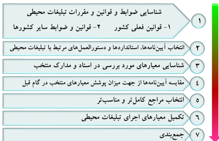
شکل ۲. روند انجام پژوهش